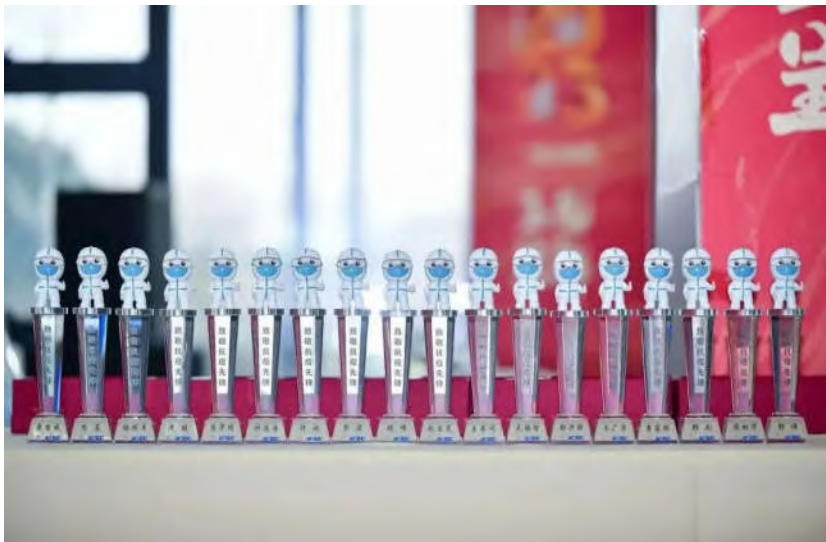
公司领导为“抗疫先锋奖”、“运维保障奖”、“招商服务奖”、“资源获取奖”、“优秀信息员奖”获奖人员颁奖。